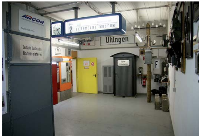
Fernsprechbude mit einer funktionierenden Freileitung