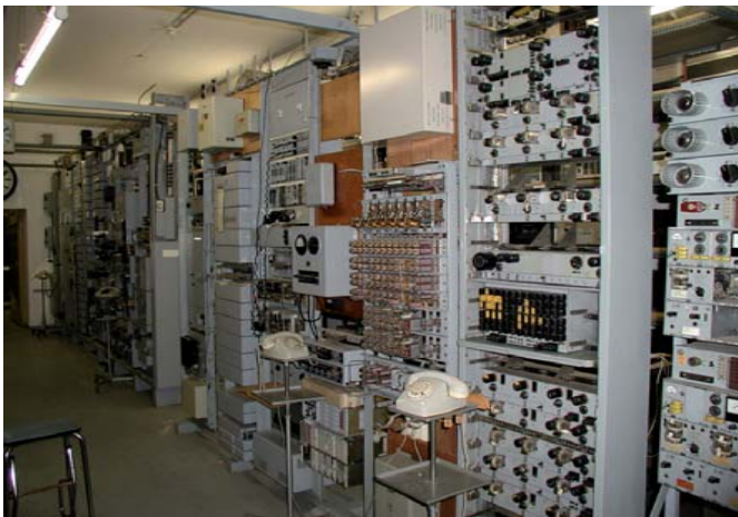
Bahnselfstanschlussanlage Basa EB V