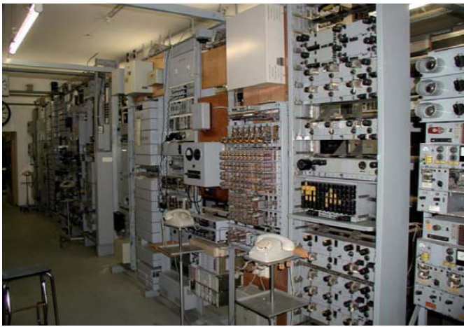
Bahnselfstanschlussanlage Basa EB V