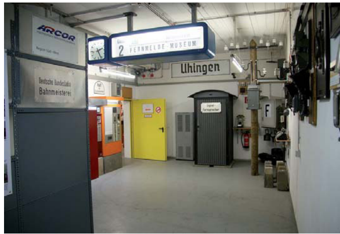
Fernsprechbude mit einer funktionierenden Freileitung