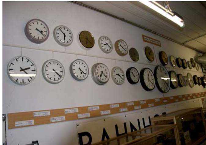
Alle 24 Zeitzonen der Welt und diverse Zwischenzeiten dargestellt